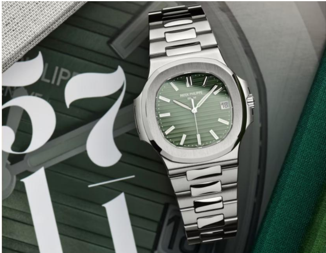
百达翡丽鹦鹉螺 Ref 5711

但这款看起来特立独行的手表在推出 40 周年时，就已经成为热门手表。那是在 2016 年，从那时起，热度就一直在上升，直到去年蒂埃里·斯特恩决定让钢制的 Ref 5711 退出市场。之后宣布了一款带有淡绿色表盘的最后一批系列，并在年底为同名零售商生产了一批带有蒂芙尼蓝色表盘的 5711 系列。