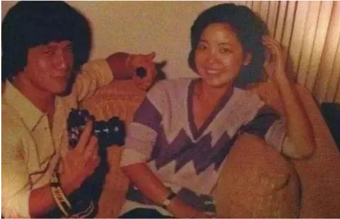
#邓老师和大鼻子男星#