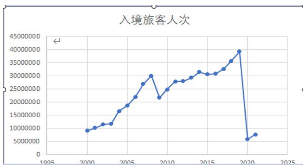
图 1 澳门 2000-2021 年出入境旅客人次

从下图 1 和图 2 由澳门统计局官方公开数据可得知，2000 年澳门入境旅客人次为 916 万人，博彩毛收入有 170 亿。